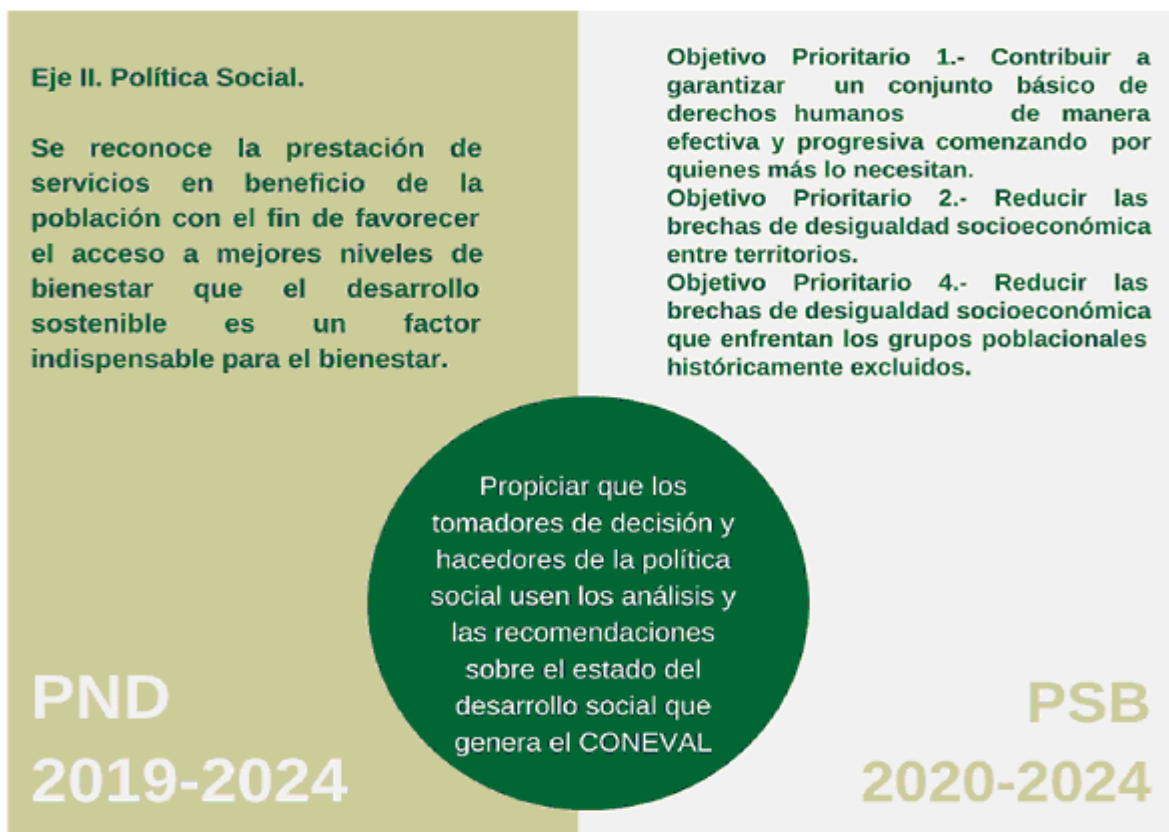
Figura 1. Alineación del objetivo prioritario del Programa Institucional 2020-2024 del Consejo Nacional de Evaluación de la Política de Desarrollo Social con la Planeación Nacional 2019-2024 y el Programa Sectorial de Bienestar 2020-2024

Fuente: Elaboración propia con base en el PND 2019-2024 y PSB 2020-2024.